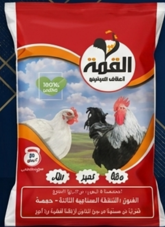
القمة: أعلاف دواجن فاخرة