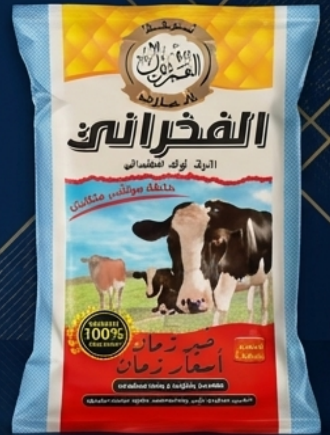
الفخراي: خلطة مواشي متكاملة

جودة بصرية استثنائية تحول الشيكارة الصناعية إلى لوحة إعلانية لعلامتك التجارية.