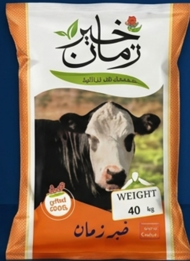
زمن: أعلاف نباتية