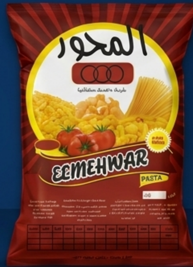
المحور: مكرونة وأغذية